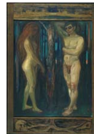
Edvard Munch: Stoffveksling Metabolism 1899