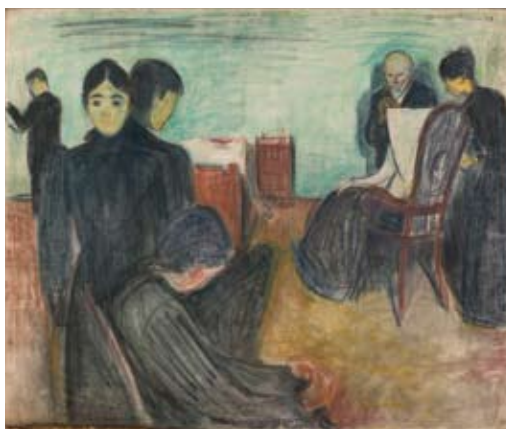
Edvard Munch: Døden i sykeværelset Death in the Sickroom 1893

The exhibition also presents a number of Munch's later works. The landscape paintings Winter in Kragera (1912) and The Yellow Log (1912) are grand compositions with emphasis on colour, structure, and perspective, and the beautiful paintings from his estate Ekely demonstrate his superior sense of colour. One of his