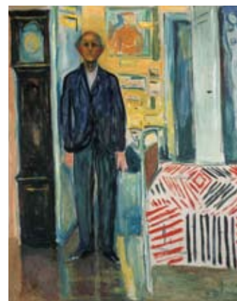
Edvard Munch: Selvportrett mellom klokken og sengen Self-portrait between the Clock and the Bed 1940-42