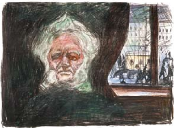
Edvard Munch: Henrik Ibsen på Grand Café Henrik Ibsen at Grand Café 1902

Occasioned by the centenary of Ibsen's death, the Munch Museum presents a separate room devoted to Munch and Ibsen. Literature played an important part in Munch's life, and Henrik Ibsen's (1828-1906) dramas influenced his art in a direct way. One of the rare meetings between the two took place at Munch's controversial Kristiania exhibition in 1895, when Munch accompanied the dramatist through the exhibition rooms. Following Ibsen's death in 1906, he was honoured with performances at the new chamber stage of Deutsches Theater in Berlin. Director Max Reinhardt commissioned Munch to make stage studies for Ghosts and Hedda Gabler , as well as to decorate one of the rooms with a series of paintings. Later, Peer Gynt became the source of inspiration for a large number of imaginative drawings from the artist's hand, and during World War I Ibsen's The Pretenders inspired Munch to create a series of dramatic woodcuts. It also seems evident that Munch identified himself with several of Ibsen's tragic characters.