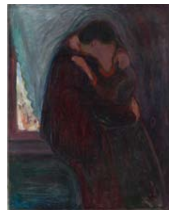
Edvard Munch: Kys Kiss 1897