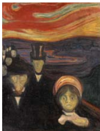
Edvard Munch: Angst Angst 1894