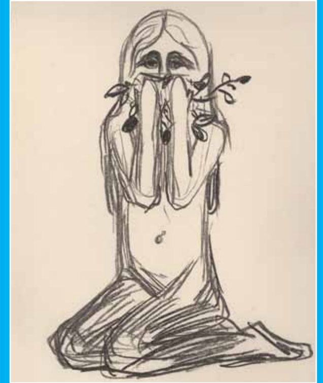
Edvard Munch: Omega og blomsten, 1908-09