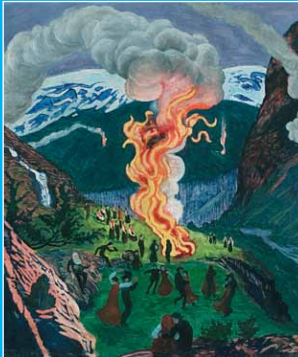
Nikolai Astrup: St. Hansbål, udatert